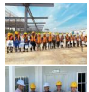
滨江高新项目、农夫山泉广西大明山项目、德清雷向大家房产项目发放高温慰问品