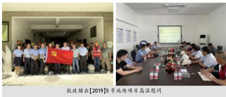
杭政储出[2019]5号地块项目高温慰问