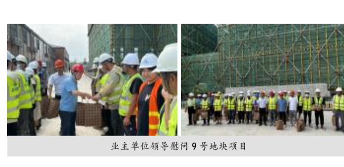
业主单位领导慰问9号地块项目