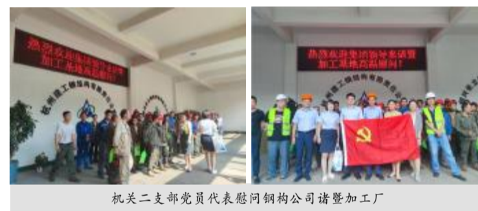
机关二支部党员代表慰问钢构公司诸暨加工厂