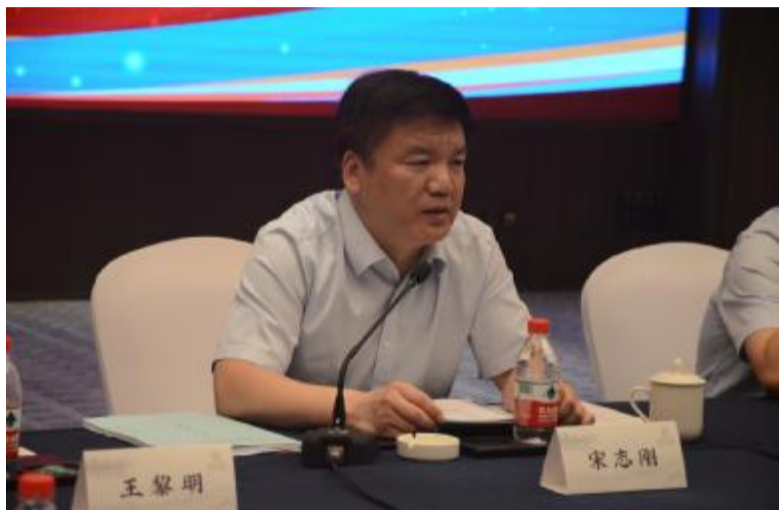
尊敬的张董事长、各位同仁：

非常高兴我们首次来到城北文澜大酒店召开杭州建工 2022 年半年度工作会议。下面，我代表经营班子对 2022 年半年度的工作做一个总结和汇报。