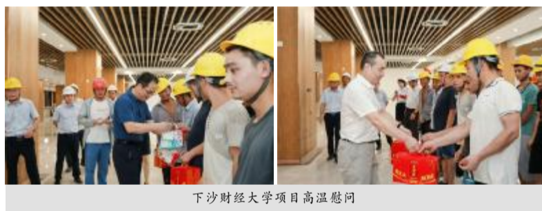
下沙财经大学项目高温慰问

开,集团联合甲方、监理、街道、城管等五方主体共同为工人们送上暖心慰问。看着工人们被晒得黝黑的皮肤、被汗湿透的衣服,大家深深体会到了他们的辛苦与不易。慰问组对项目部全体员工和工人表达了感谢,同时强调要加强安全管理,切实做好降温防暑工作,合理安排作业时间,保障工人们的安全。 当一份份饱含心意与关怀的清凉礼包送到民工手上,他们的脸上露出了纯朴的笑容。高温仍在继续,但工友们一直坚守岗位,用他们的汗水确保工期的按时完成,一份清凉,一份关爱,把集团对一线工人的关心和关爱落到了实处,更极大地鼓舞了一线工友们的士气,为企业发展提供了强有力的保障。 (综合办 李雯)