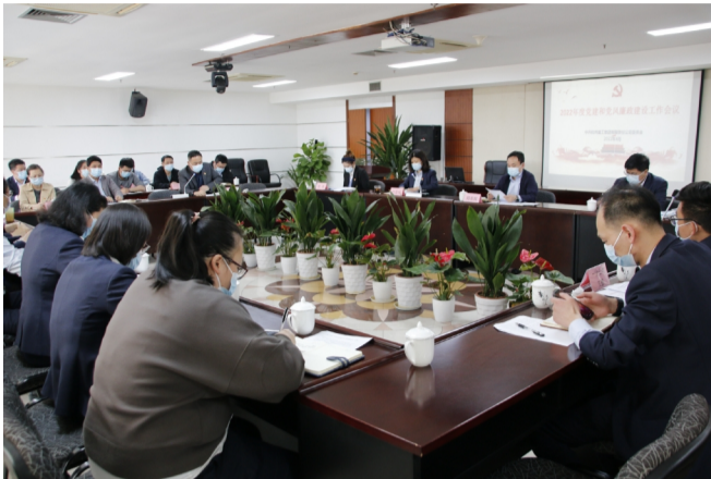
集团党委召开2022年度党建和党风廉政建设工作会议

二是要坚持把党建融入中心工作。党建也是生产力,要充分发挥党建工作对生产经营工作的引领和促进作用;要把党建和生产经营、管理工作结合起来,在当前形势下,具体要在疫情防控、激发员工的创新创业精神以及为经营管理做好政治思想保障等工作方面发力;要充分利用好党建联建工作