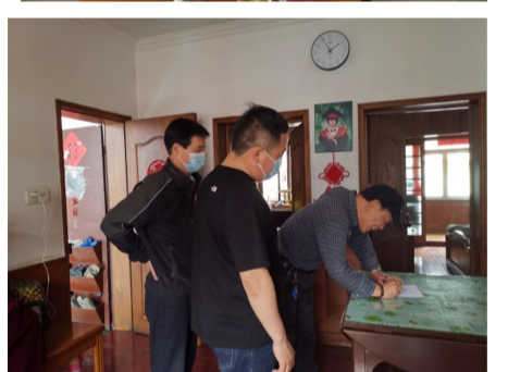
鼓励在职劳模、工匠珍惜荣誉,立足岗位,尽职尽责,继续发挥模范带头作用,为企业的高质量发展建功立业做出更大贡献。(杭安公司 韩伟娜;杭构集团 李俊奇)