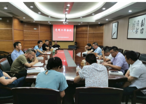
届一次董事会会议精神进行了贯彻学习。

杭安公司将正确把握党群工作面临的新要求，围绕企业中心任务持续抓好党建工作核心，充分发挥职工积极性，做实做细团工作，切实提升公司党群工作水平，进一步推动企业创新发展。